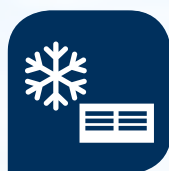
Systemy chłodzenia powietrza