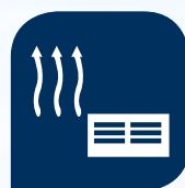
Systemy ogrzewania powietrza