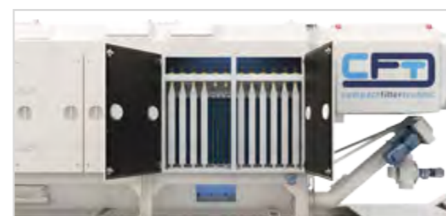
CFD z koszem zbierającym pył i przenośnikiem ślimakowym wyładowczym