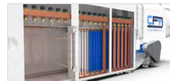
CFD z przenośnikiem wyładowczym z łańcuchem zgrzebłowym