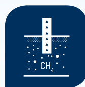
Wychwytywanie i wykorzystanie metanu